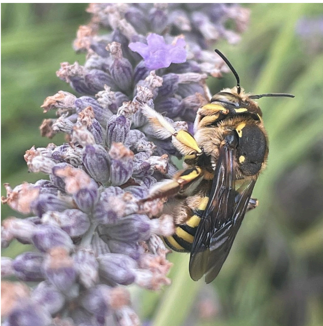
Anthidium manicatum [abeille cotonnière] sur lavande. Jardin, 12 juillet 2024 © Musée Voulard